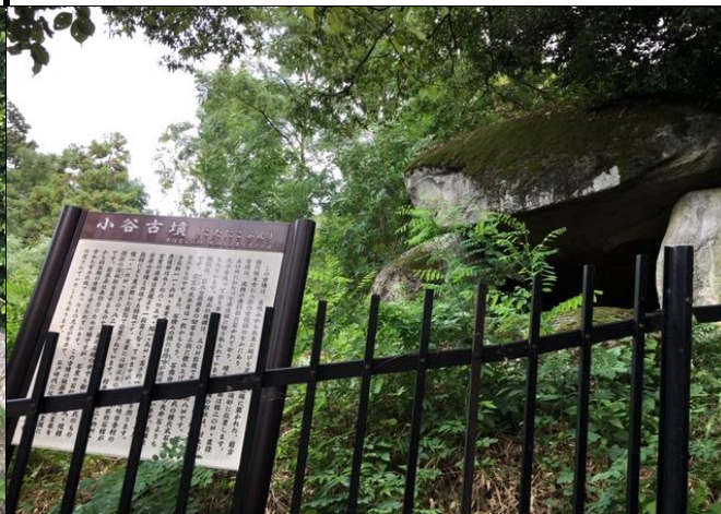
柵内にある橿原市教育委員会の説明板