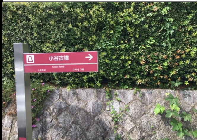
住宅街古墳付近にある誘導板