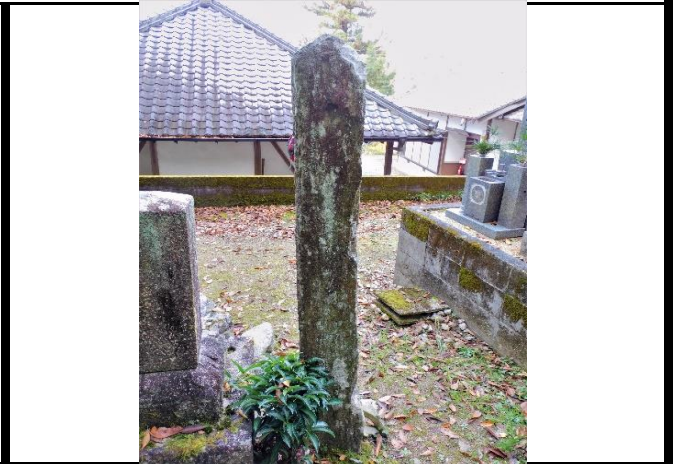
正面には梵字や多数の文字が彫られている