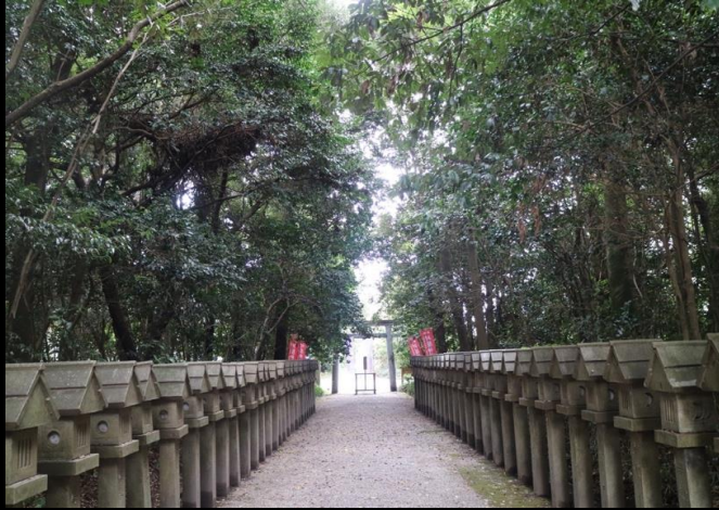
本殿近くまで成育する竹