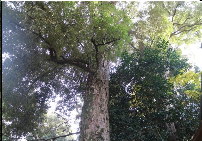
台風により傾いたイチイガシ