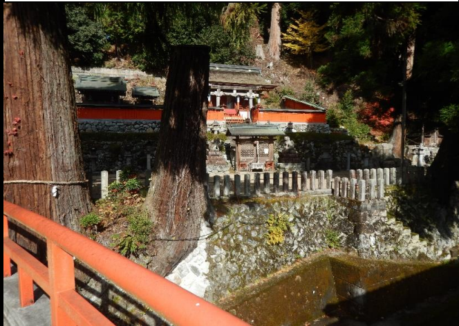
手前の太鼓橋より社殿を望む