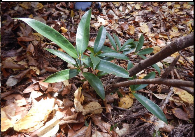
近づいてみると・・・