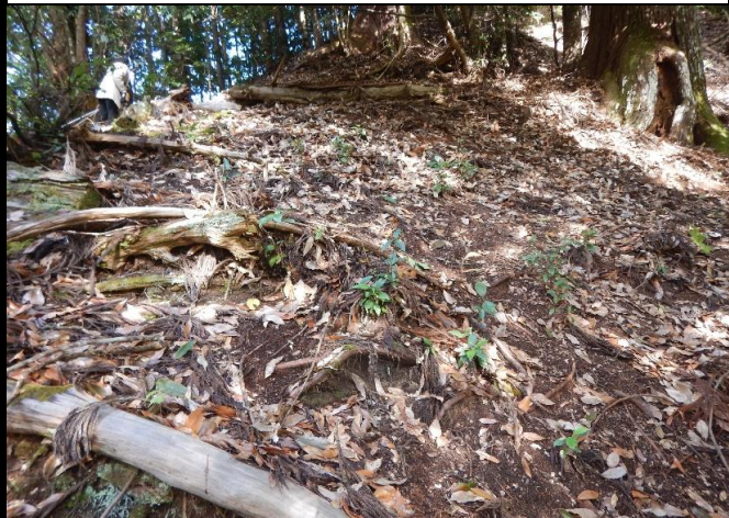
本殿背後の裏山の南斜面