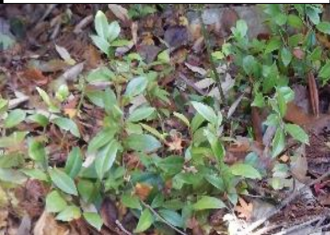
つるが伸びた様子