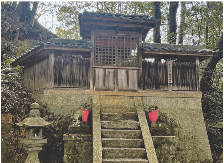
波多甕井神社の社殿—高取町で