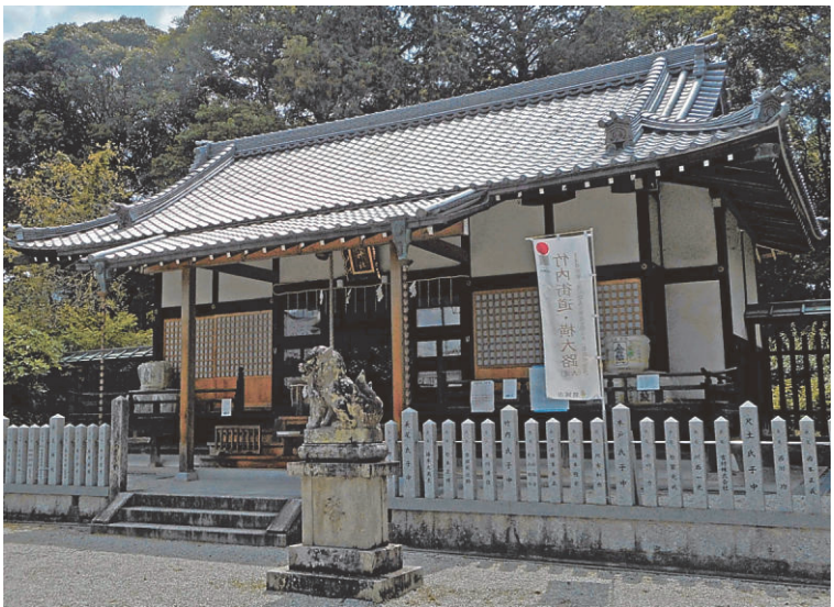
長尾神社拝殿―葛城市で